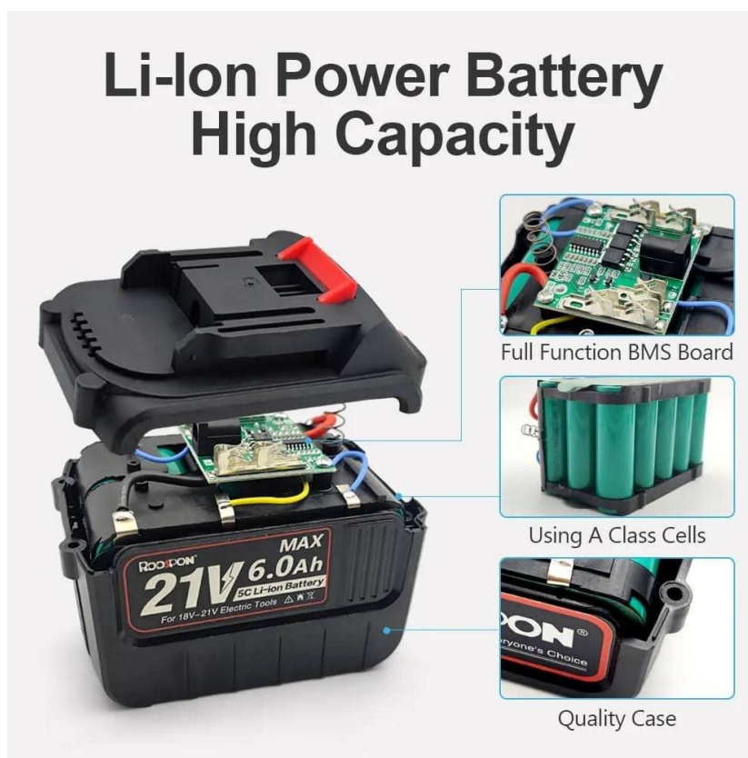
Рисунок 3 – Сучасна будова Li-Ion акумуляторної батареї.