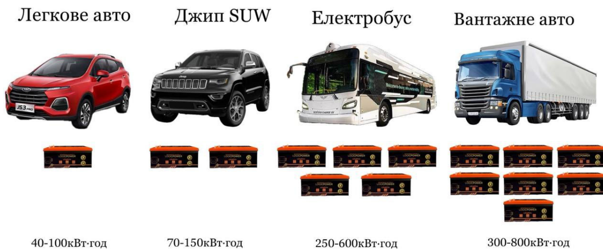
Рисунок 4 – Кількість літій-іонних модульних секційних АКБ, необхідних для транспортних засобів різного типу.

– Батарейний блок: Високоінтегрований блок, що включає кілька великих модулів, які забезпечують значний запас ходу та потужність для важкого транспорту.