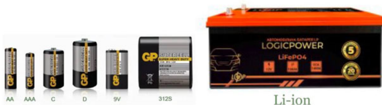
Рисунок 2 – Використання модульного принципу секційного випуску, експлуатації та заміни споживчих батарейок та АКБ електромобілів.

без винятку. Така розмірна уніфікація дозволить відійти від персоніфікованої дорогої швидкісної зарядки АКБ, звести до мінімуму час заряджання шляхом заміни розряджених батарей на заряджені. Об'єктивна діагностика стану і справності АКБ допоможе вирішити фінансові питання у випадку, коли знімається АКБ з пошкодженнями, а ставиться абсолютно придатна перевірена. Має бути винайдена і сплачена різниця їх вартості, причому це буде тільки вартість відновлення, а не купівлі нової АКБ. Створення мережі таких станцій зарядки та відновлення АКБ, у міжнародному сполученні тощо, дозволить мінімізувати вартість зарядки (заміни АКБ), тому що заряджатись всі АКБ на таких станціях будуть не швидкісним прискореним дорогим методом, а звичайним способом, вночі, коли вартість кВт·год має найменший тариф.