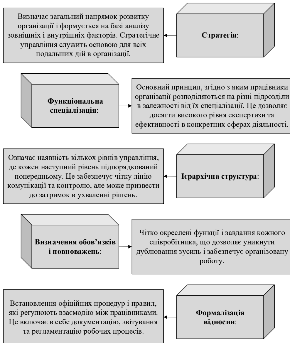
Рисунок 2 – Система парадигми проектування організації