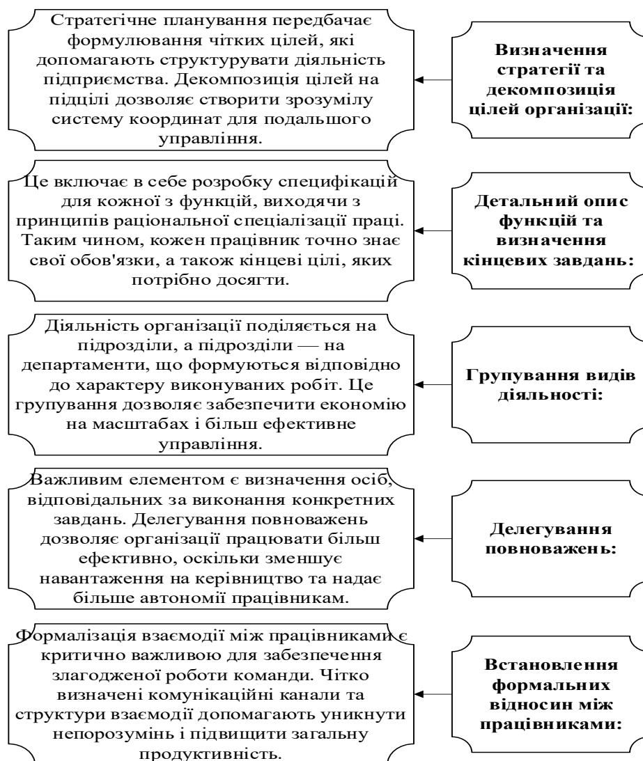
Рисунок 1 – Ключові аспекти класичної теорії організації реінжинірингу

• Вимірювання результативності процесів: Важливим аспектом є моніторинг і оцінка ефективності впроваджених змін. Це дозволяє підприємствам адаптуватися до нових умов та постійно вдосконалювати свої процеси.