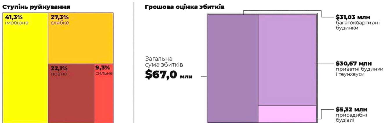
Рисунок 2 – Ступінь руйнування будівель житлової забудови та сума збитків смт. Макарів [2]