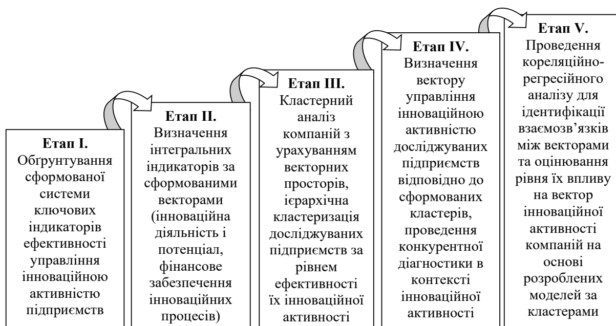
Рисунок 2 – Етапи моделювання впливу управління інноваційною активністю підприємств на ефективність їх діяльності