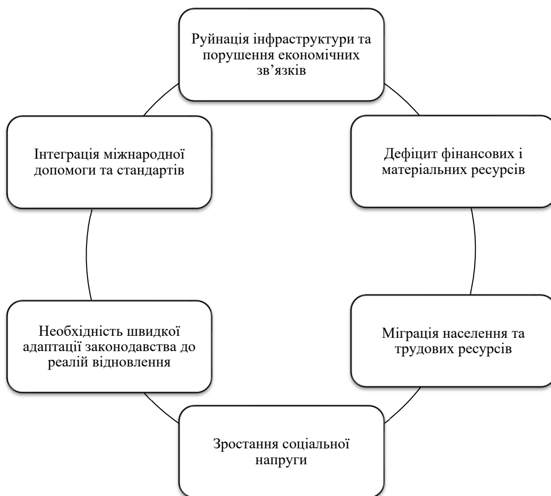
Рисунок 3 – Ключові виклики щодо системи адміністративного менеджменту Figure 3 – Key challenges to the administrative management system

Ці виклики потребують оперативних і водночас стратегічно продуманих рішень, з урахуванням принципів сталого розвитку.