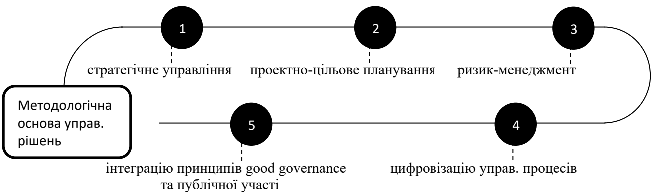
Рисунок 1 – Методологічна основа управлінських рішень Figure 1 – Methodological basis for management decisions