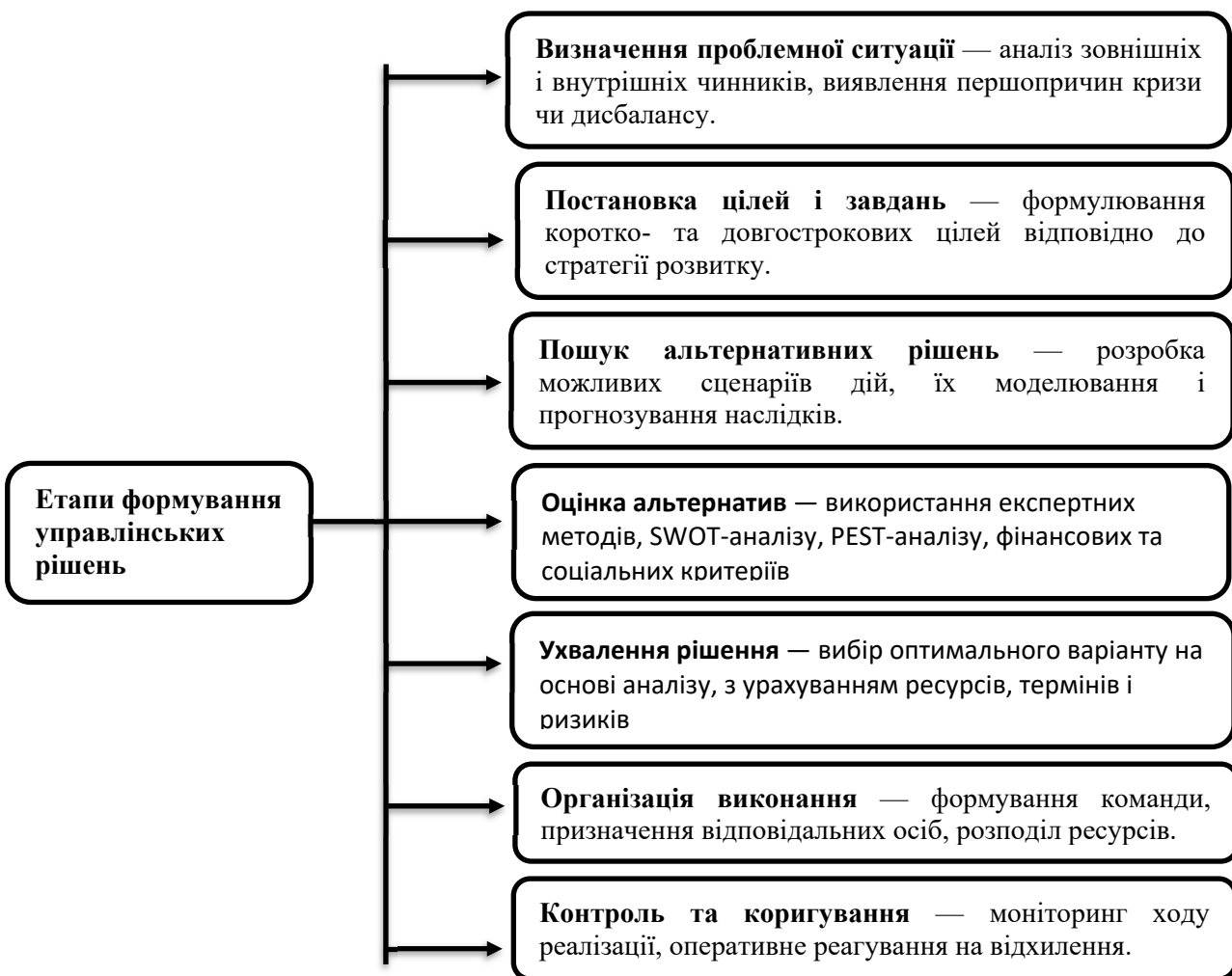
Рисунок 2 – Етапи формування управлінських рішень Figure 2 – Stages of formation of managerial

Процес формування управлінських рішень включає основні сім етапів (рис. 2):