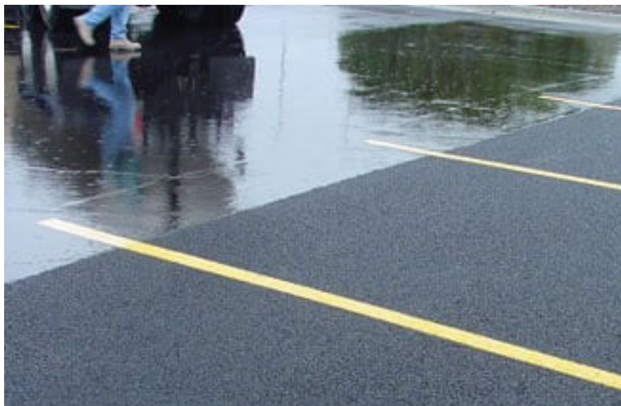
Рисунок 1 – Відмінність дренажних асфальтобетонів від типових щільних Figure 1 – The difference between draining asphalt concrete and typical dense concrete

покриттям з щільного асфальтобетону - на 50 %, перевищуючи його за абсолютним значенням майже в 2 рази.