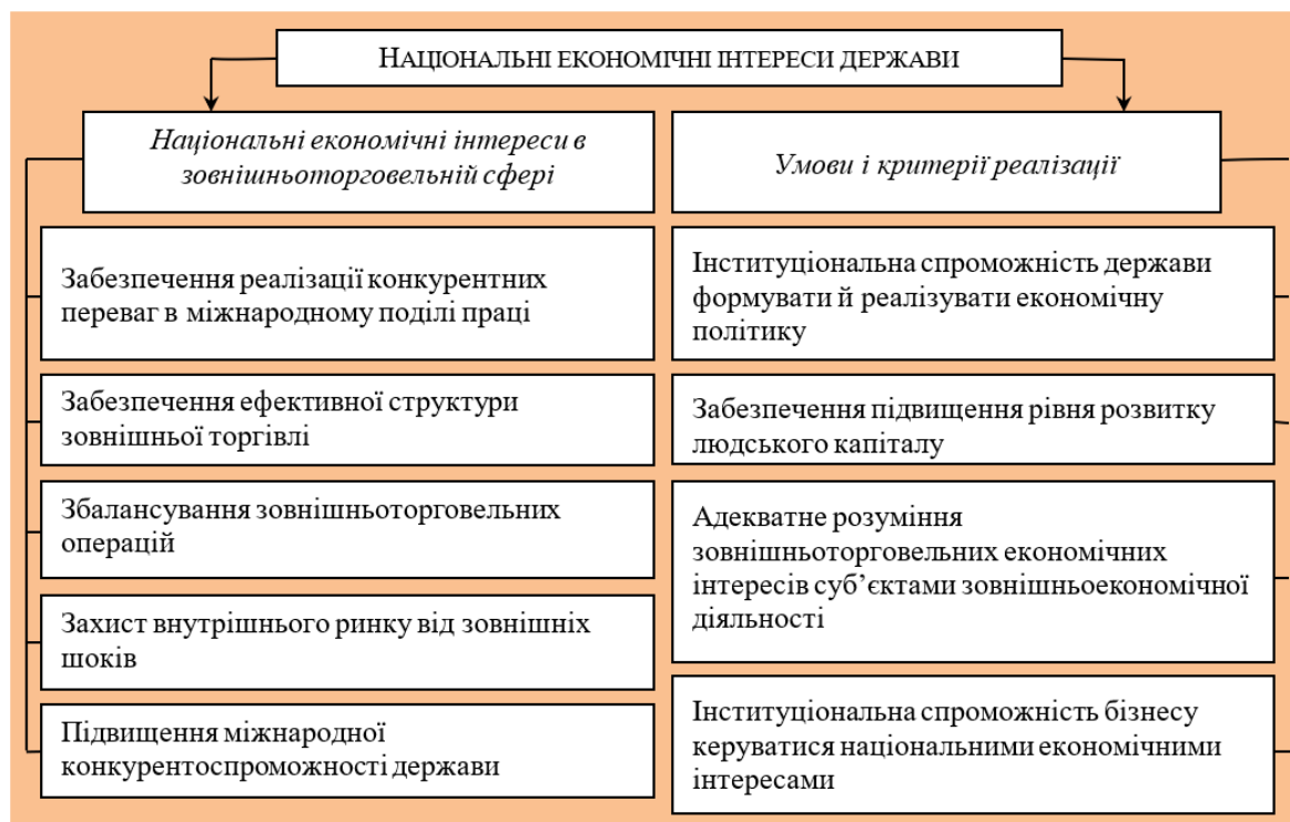
Рисунок 3 – Національні економічні інтереси в зовнішньоторговельній сфері Figure 3 – National economic interests in foreign trade

стійкості до викликів; активізація інноваційних процесів в освітній, науково-технологічній та інформаційно-комунікаційній галузях; розширення участі України в міжнародних організаціях та просування на шляху євроінтеграції за умов забезпечення економічних інтересів України.