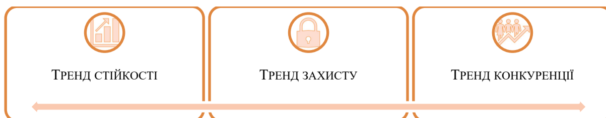
Рисунок 2 – Базові тенденції формування політики економічної безпеки в розвинених країнах Figure 2 – Basic trends in the formation of economic security policy in developed countries

3. Тренд конкуренції: конкуренція є невід'ємною частиною глобальної економіки, яка забезпечує технологічний прогрес, якісні ресурси та ефективне виробництво. Країни з розвинутою економікою дедалі частіше інвестують у свою промисловість і технології, щоб конкурувати з іншими країнами [2].