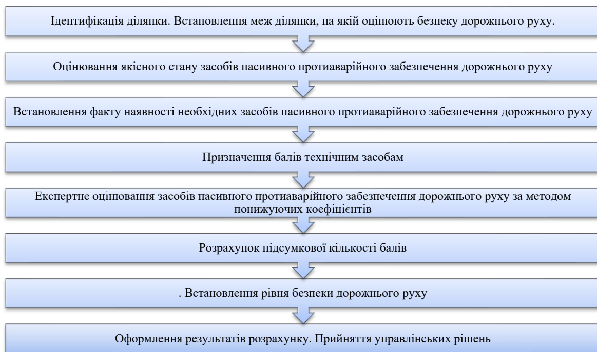
Рисунок 1 – Алгоритм оцінювання рівня безпеки дорожнього руху

Алгоритм оцінювання рівня безпеки дорожнього руху наведений на рисунку 1.