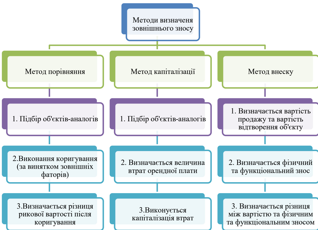
Рисунок 2 – Алгоритм застосування методів визначення зовнішнього зносу Figure 2 – Algorithm for applying methods of determining external depreciation

Пропонується наступний алгоритм застосування методів визначення зовнішнього зносу (рис. 2).