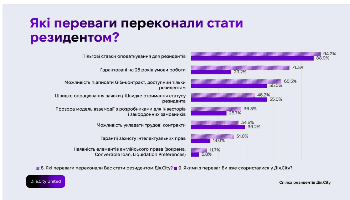
Рисунок 2 – Мотивація стати резидентом Дія.Сіті [6] Figure 2 – Motivation to become a resident of Diya.City [6]

Окремо слід відзначити секторальну динаміку: резидентами стають не лише ІТ-компанії, але й підприємства у сферах MilTech, робототехніки, виробництва технологічних продуктів, освіти, маркетингу, цифрової техніки та R&D. Це підтверджує розширення моделі «Дія.Сіті» у напрямі