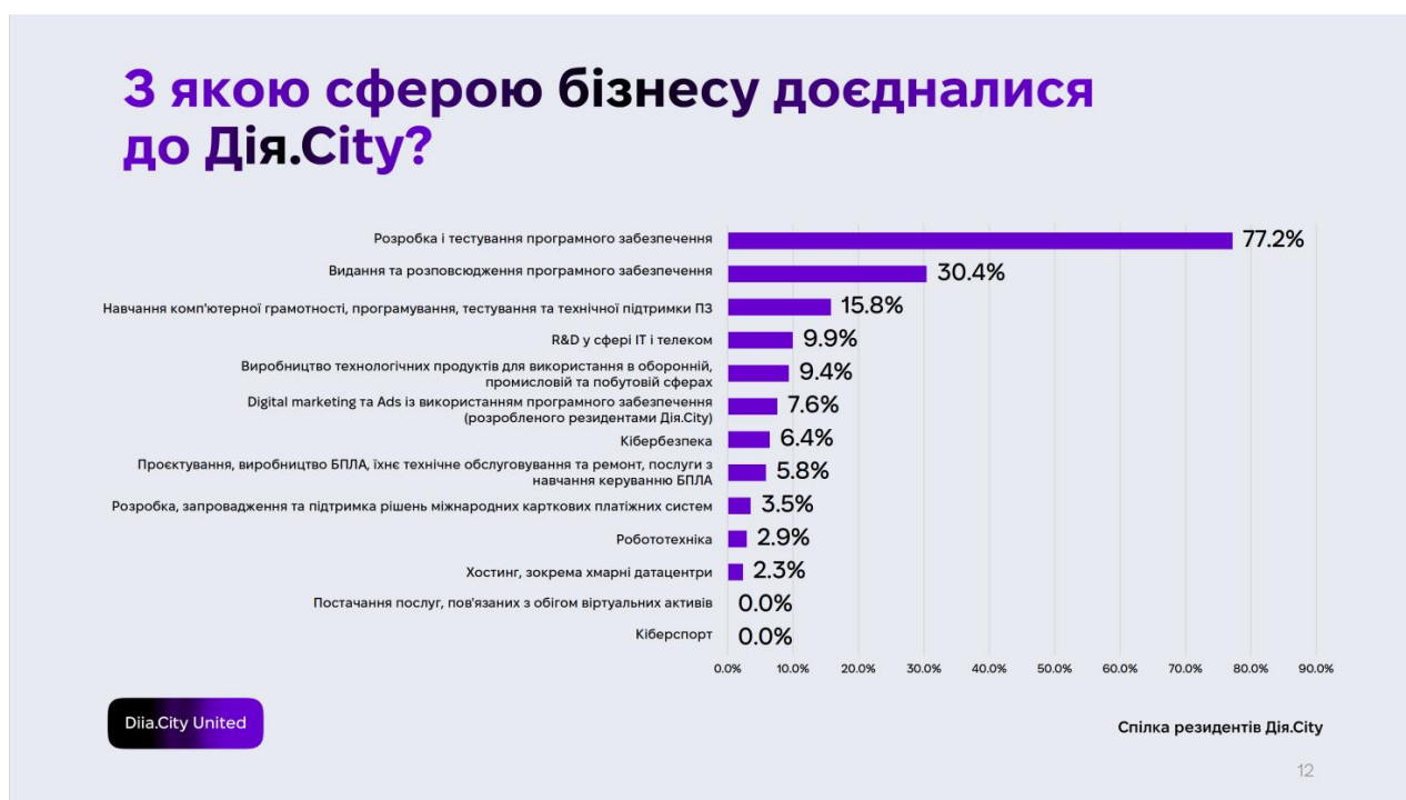
Рисунок 3 – Секторальна структура резидентів Дія.Сіті [6]

національної інноваційної екосистеми, а не вузького ІТ-кластера. Понад 33 % потенційних резидентів розглядають можливість приєднання найближчим часом, але 23 % компаній відмовилися через критерії — переважно щодо кількості спеціалістів і рівня зарплат.