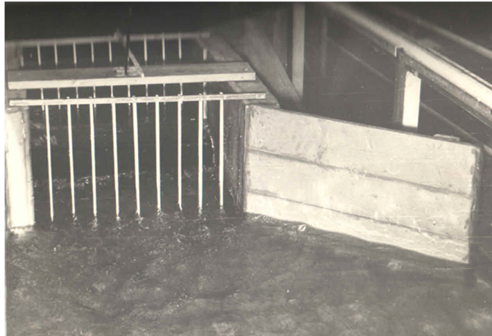
Рисунок 2 – Модель споруди у гідравлічному лотку лабораторії кафедри в масштабі 1:40 Figure 2 – Model of the structure in the hydraulic tray of the department's laboratory at a scale of 1:40

Було зроблено висновок, що для розрахунку руху води в зрошувальних каналах при автоматичному регулюванні, доцільно застосовувати математичну модель у вигляді граничної задачі для рівнянь Сен-Венана. Оскільки водоспоживання в таких каналах змінюється з часом, реальні умови протікання води відповідають режиму неусталеного руху.