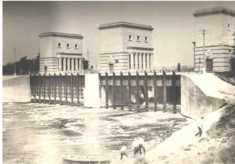
Рисунок 1 – Загальний вигляд основної споруди ПКК Figure 1 – General view of the main building of the PCC

Перехідні процеси, які виникають під час перерегулювання режиму водоспоживання або внаслідок аварійних ситуацій, є важливим аспектом функціонування зрошувальних каналів. Основу таких процесів становить неусталений рух рідини у каналах, який математично можна описати за допомогою рівнянь Сен-Венана (1):