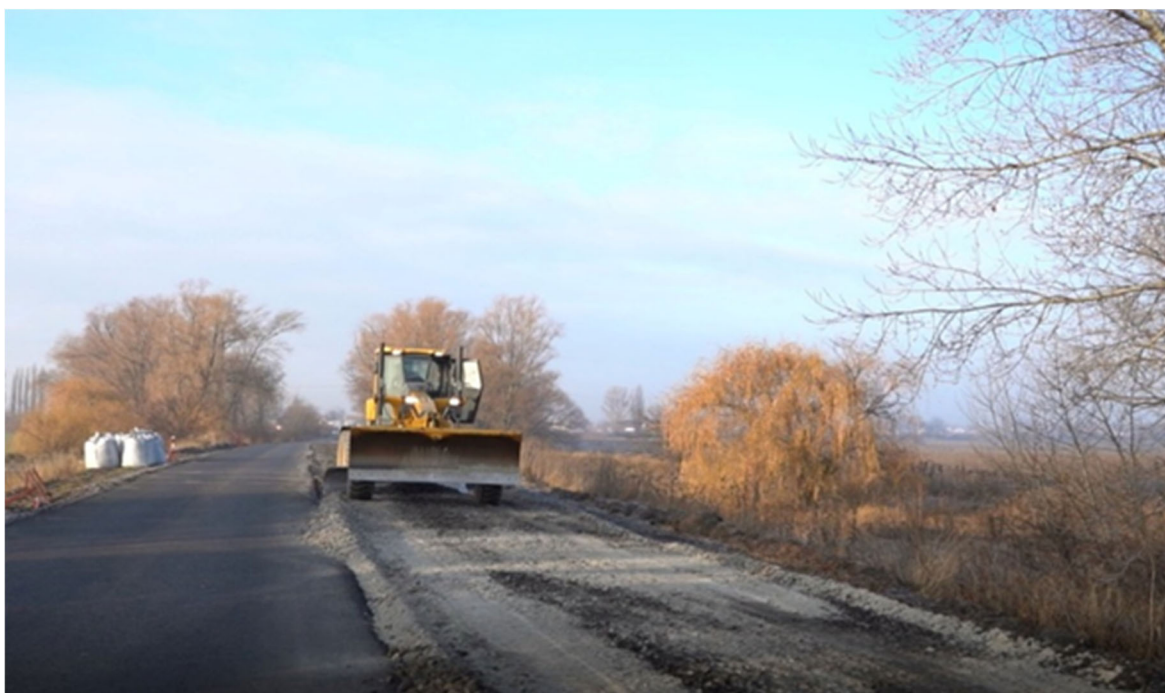
Рисунок 1 — Процес будівництва на автомобільній дорозі Т-10-18 Бориспіль – Березань – Яготин, км 3+227 – км 5+227

Розпорядженням Кабінету Міністрів України від 04 грудня 2019 року № 1420-р. сприяло використанню золошлакових матеріалів в дорожньому будівництві в Україні. Одним з варіантів використання ЗШМ в дорожньому будівництві є матеріал, виготовлений за технологією холодного ресайклінгу з додаванням золи-виносу. Було влаштовано експериментальну ділянку на автомобільній дорозі Т-10-18 Бориспіль – Березань – Яготин, км 3+227 – км 5+227 з шаром дорожнього одягу з матеріалу, виготовленого за технологією холодного ресайклінгу з використанням золошлакових матеріалів.